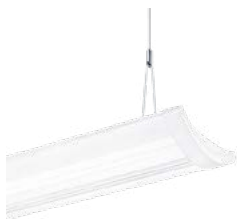
IQ Wave Pendelleuchte