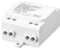
basicDIM Wireless Repeater, um die Reichweite zu erhöhen oder um bestehende, klassische Wandtaster einzubinden