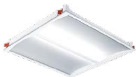
IQ Wave Einbauleuchte